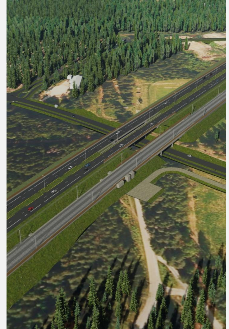
Vei og bane