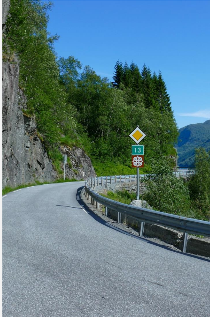
Ras og punktutbedring